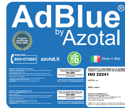
Etichetta uso professionale Professional label

PRODOTTO PER USO PRIVATO E PROFESSIONALE CONSIGLI DI PRUDENZA: conservare il recipiente perfettamente chiuso e fuori dalla portata dei bambini. AVVERTENZE D'USO: tutte le operazioni di manipolazione del prodotto devono essere eseguite con recipienti ed accessori ben puliti ed in conformità con le norme a lato riportate. Conservare al riparo dalla luce solare diretta e da fonti di calore. TEMPERATURE DI STOCCAGGIO: da - 5°C a + 30°C INGREDIENTI: urea pura 32 %, acqua dissalata 68 %