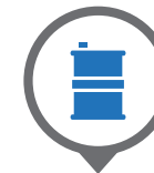
Tank 200 lt