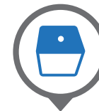
Tank 1000 lt