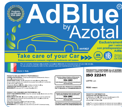
Etichetta uso privato Consumer label

PRODOTTO PER USO PRIVATO E PROFESSIONALE CONSIGLI DI PRUDENZA: conservare il recipiente perfettamente chiuso e fuori dalla portata dei bambini. AVVERTENZE D'USO: tutte le operazioni di manipolazione del prodotto devono essere eseguite con recipienti ed accessori ben puliti ed in conformità con le norme a lato riportate. Conservare al riparo dalla luce solare diretta e da fonti di calore. TEMPERATURE DI STOCCAGGIO: da - 5°C a + 30°C INGREDIENTI: urea pura 32 %, acqua dissalata 68 %