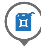
Tank 10 lt