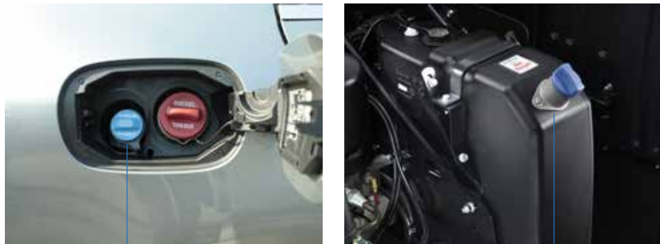
Car AdBlue® by Azotal, l'apposito bocchettone predisposto per automobili e camion AdBlue® by Azotal, the right pipe connection for cars and trucks Truck

Il consumo medio di AdBlue® by Azotal è generalmente intorno al 5% della quantità di gasolio usato, quindi avrete bisogno di circa cinque litri di AdBlue® by Azotal per ogni cento litri di gasolio consumato. L'AdBlue® by Azotal oggi si può trovare presso le maggiori stazioni di servizio, presso i fornitori di prodotti petroliferi e di ricambi e presso la rete di vendita e di assistenza dei